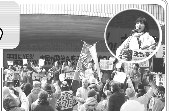
2017/10/15に開かれた『平和にYES！改憲にNO！『市民が政治を変える！札幌アクション』』