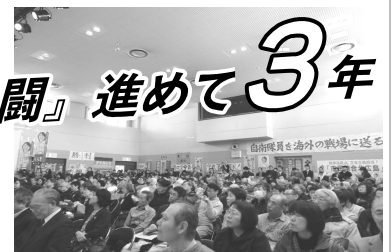
池田まきさんと語る市民集会 (2016/3/5 厚別区民センター)