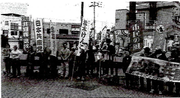
北区街宣。市民と野党がひとつになり、道行く人々に訴えた